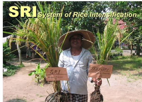
À gauche: Un plant de riz cultivé avec la Méthode SRI. À droite: une plante de riz cultivée de façon conventionnelle.