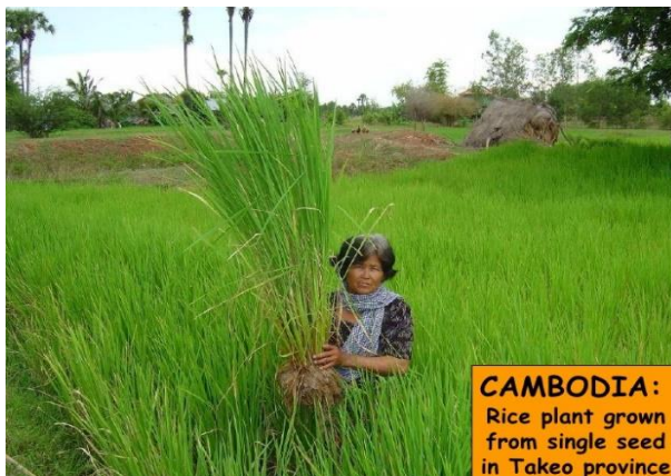
Cambodge: un plant de riz issu d'une seule graine